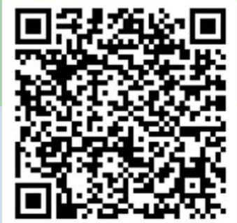
ระบบตรวจวัดสภาพอากาศอำเภอแม่จัน

ออกแบบและสร้างระบบการแจ้งเตือนการเปลี่ยนแปลงสภาพอากาศ และพัฒนาอุปกรณ์รับส่งข้อมูลระยะทางไกลผ่าน โดยใช้เทคโนโลยีอินเทอร์เน็ตสรรพสิ่งไร้สายแบบวงแคบพิเศษ