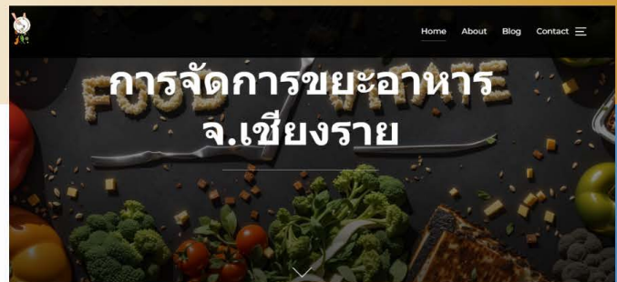
เศรษฐกิจหมุนเวียน (Circular Economy) / โซ่อุปทานหมุนเวียน

เพื่อสำรวจปริมาณขยะอาหาร วิธีการใช้ ประโยชน์จากขยะอาหาร และความต้องการใช้ ขยะอาหารในจังหวัดเชียงราย