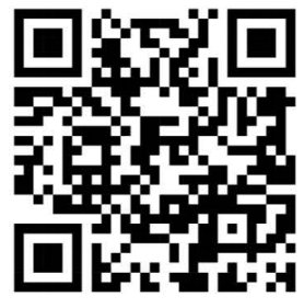
คู่มือกิจกรรมการเรียนรู้ภัยพิบัติ