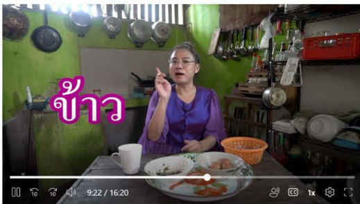
สื่อการดูแลสุขภาพตนเองของผู้สูงอายุ