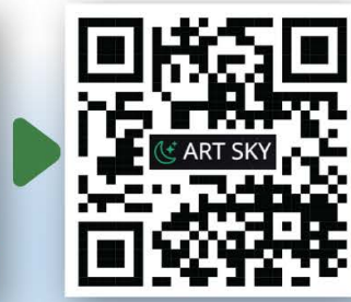
Website : ART SKY