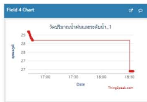
แสดงข้อมูลพื้นที่บริเวณตำบลแม่ยาว อ.เมือง จ.เชียงราย