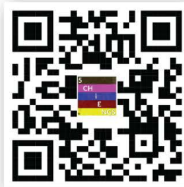
ชุดบทประพันธ์เพลง