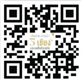
คอลเลกชันผลิตภัณฑ์แฟชั่น